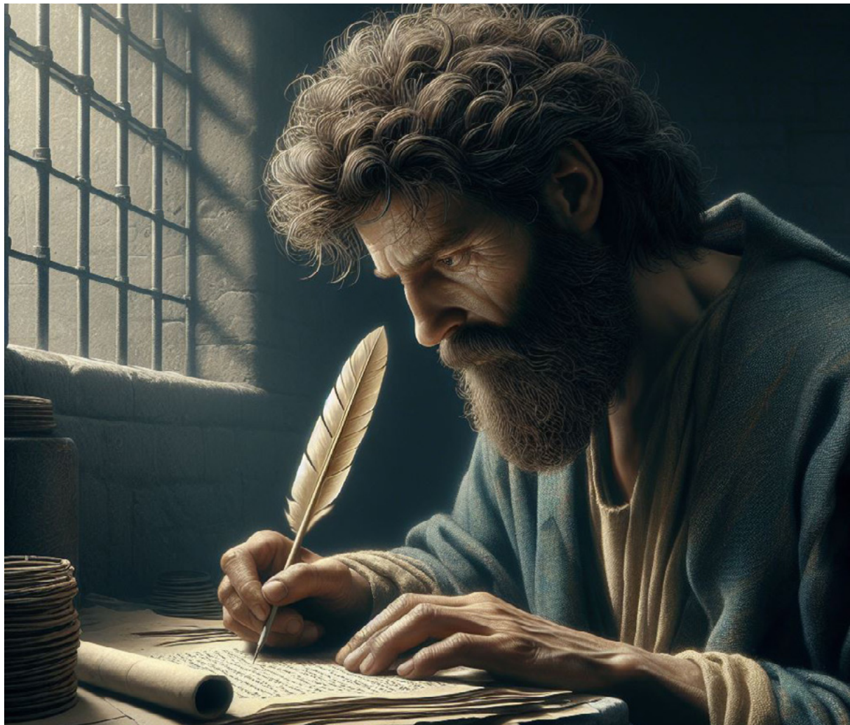
Paulo escrevendo sua epístola aos Efésios