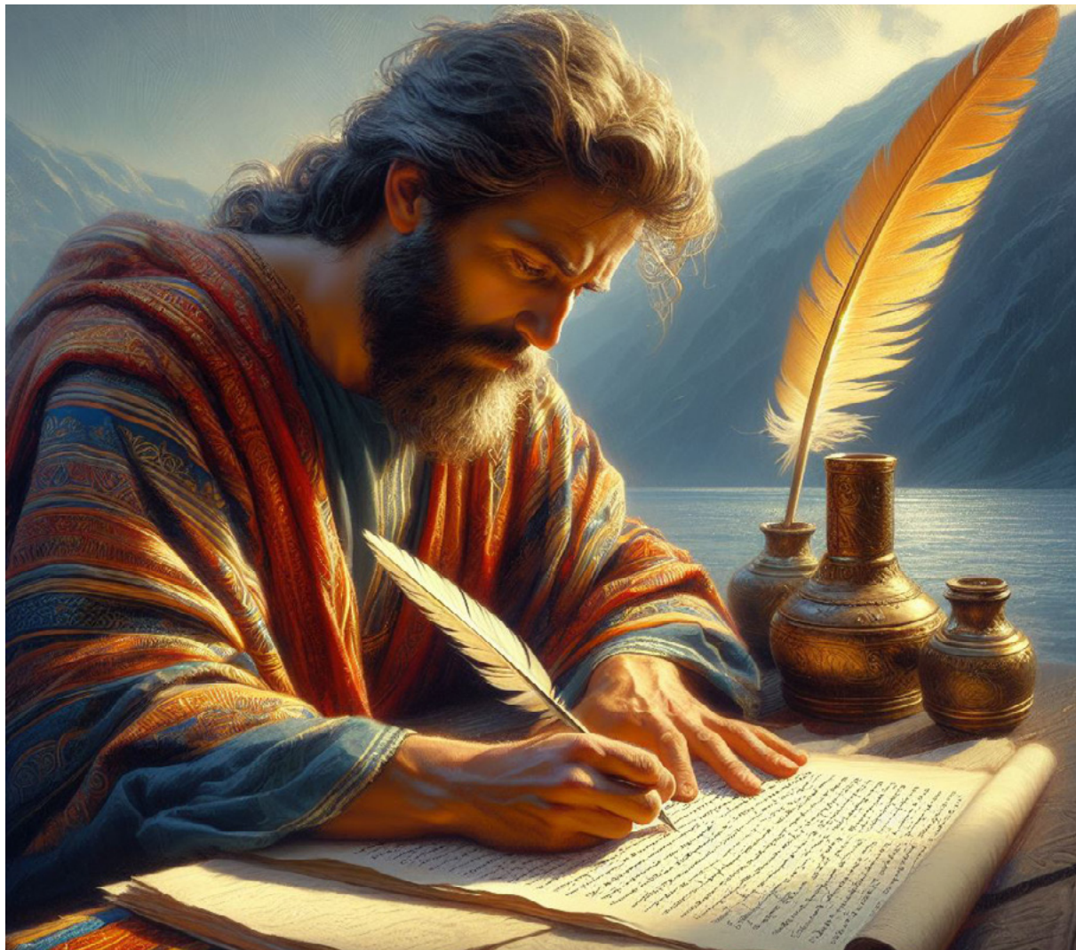
Paulo escrevendo sua epístola aos filipenses