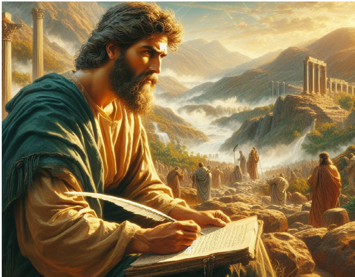
Paulo escrevendo sua epístola aos Colossenses