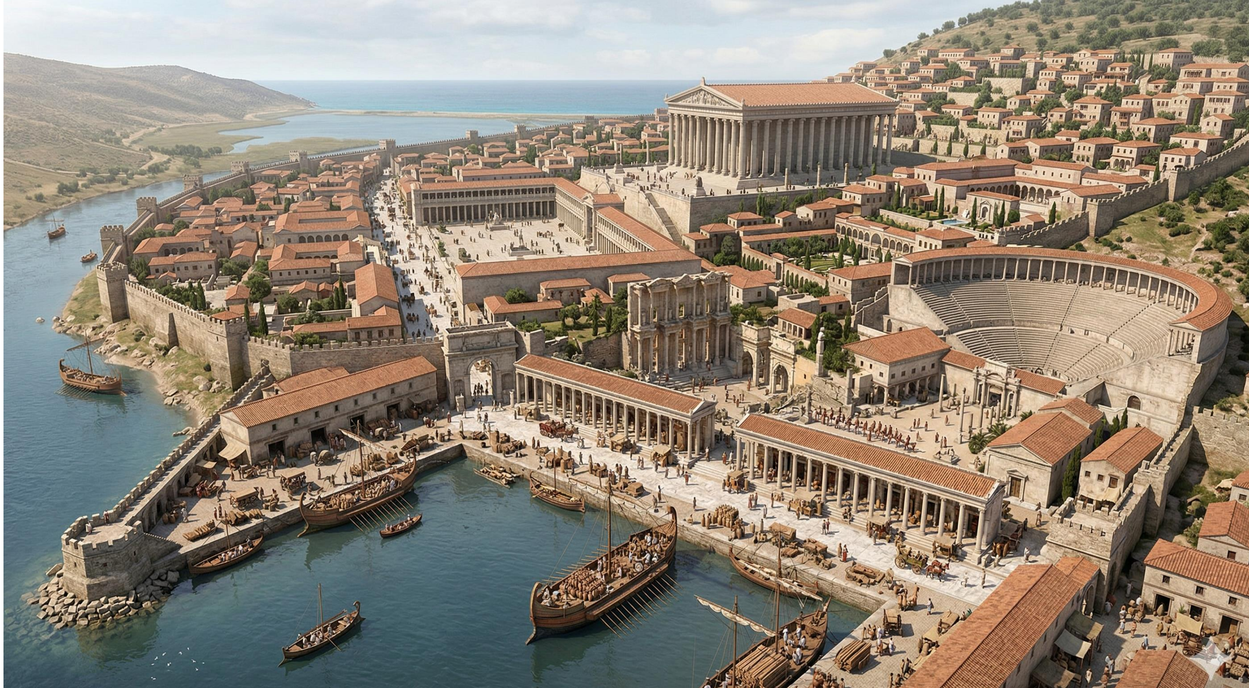
EFESOS, LATIN COLONY, LATE 1ST CENTURY AD - HARBOR AND CITY RECONSTRUCTION (2024 Arch. Data)