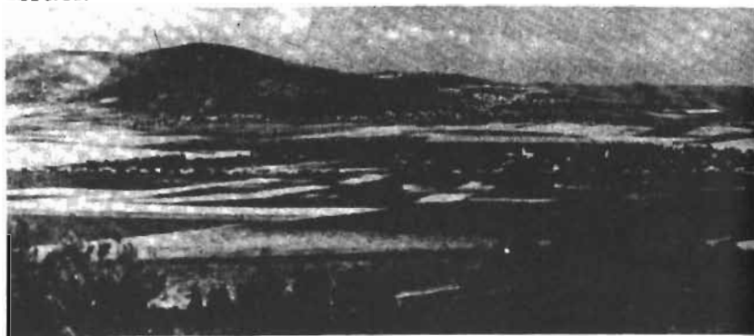
Vista geral da planície de Armagedom

O termo Armagedom significa monte de Megido . Trata-se do local ao norte de Israel onde se travará a batalha final. Esse lugar tem sido famoso como campo de batalha da história, dada a posição estratégica que ocupa. Aí concentrar-se-ão as forças das nações em guerra contra Deus e Israel.