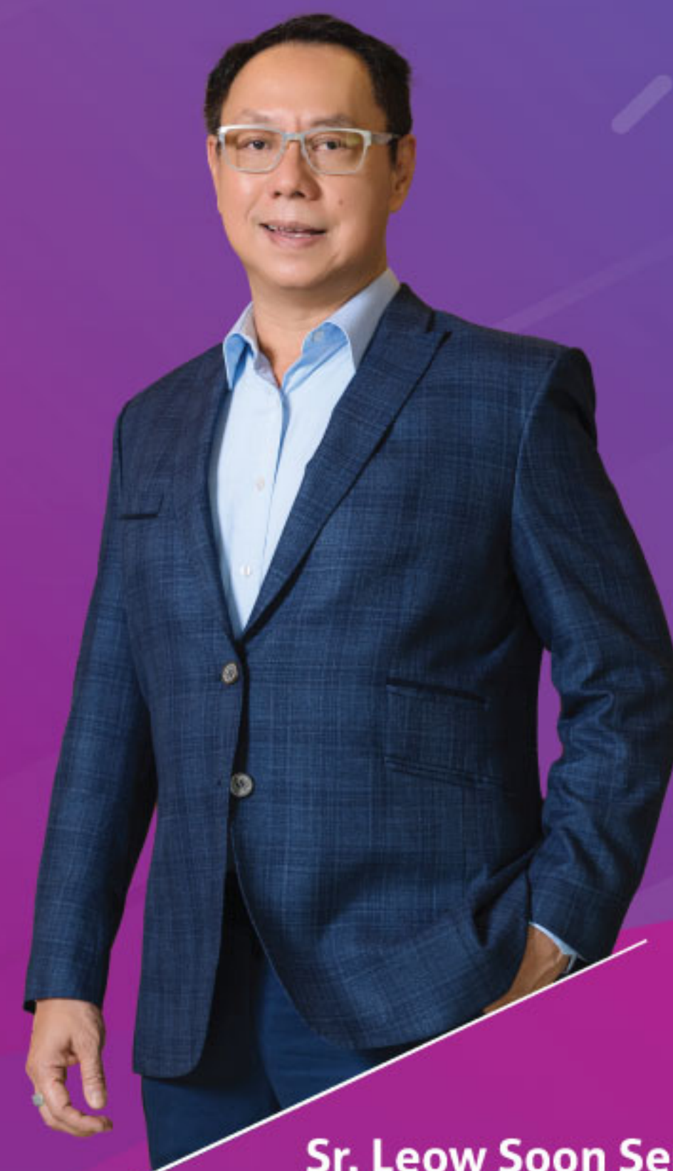
Sr. Leow Soon Seng Fundador y Presidente de Gano Excel

* NOTA: EL EJERCICIO ANTERIOR SE ENCUENTRA DESARROLLADO COMO UN EJEMPLO CON COMPRA DE PAQUETE ESP 3 AL MOMENTO DE LA INSCRIPCIÓN. ESTÁ BASADO EN DÓLARES AMERICANOS. EL PAGO SE HARÁ EN PESOS DOMINICANOS AL TIPO DE CAMBIO VIGENTE EN GANO EXCEL REPÚBLICA DOMINICANA AL MOMENTO DE GANAR LA COMISIÓN. ES CONSIDERADO ANTES DE IMPUESTOS APPLICABLES Y NO CONSTITUYE UNA GARANTÍA DE NIVEL DE INGRESOS NI PROMESA DE OBTENCIÓN DE LOS MISMOS. PARA MAYOR INFORMACIÓN CONSULTE NUESTRO SITIO WEB GANO EXCEL www.ganoexcel.do O PÓNGASE EN CONTACTO CON NUESTRO DEPARTAMENTO DE ATENCIÓN A CLIENTES AL 829-607-2141 O A TRAVÉS DEL CORREO servicios@ganoexcel.do