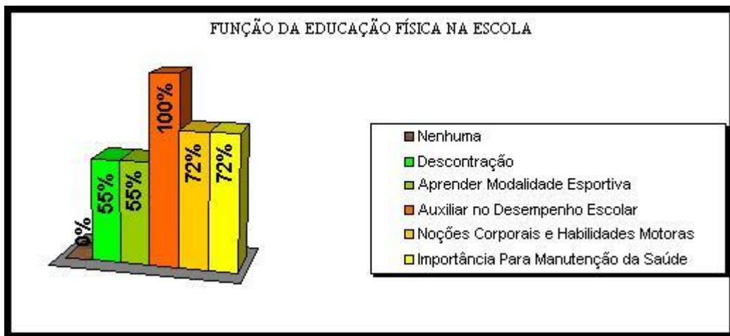
FIGURA 2 Indicação dos professores quanto à função da Educação Física na escola

Outro aspecto investigado junto aos professores participantes da pesquisa foi à representação que esses têm sobre a função da Educação Física na escola. A figura 2 apresenta o percentual de ocorrências das indicações dos professores.