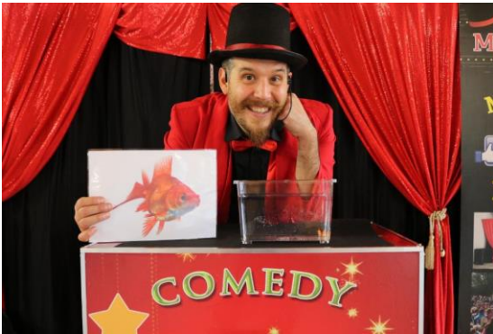
Mago Tornado: Illusionista, artista poliedrico, comico e formatore. www.magotornado.com