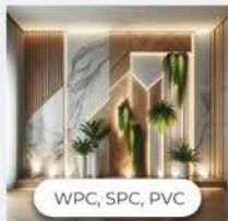
WPC, SPC, PVC