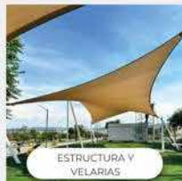
ESTRUCTURA Y VELARIAS