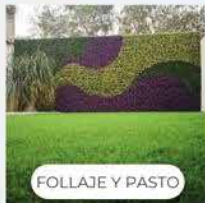
FOLLAJE Y PASTO