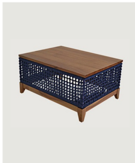
MESA DE CENTRO EM FIBRA SINTÉTICA TAMPO EM MADEIRA