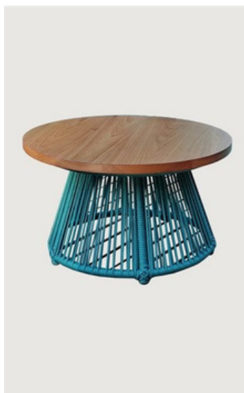
MESA DE CENTRO TAMPO EM MADEIRA