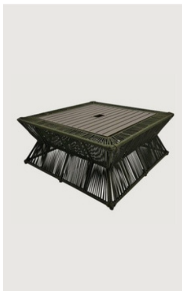
MESA DE CENTRO QUADRADA EM ALUMÍNIO RIPADO

Mesas de Centro para áreas externas e internas em alumínio, com acabamento em fibra sintética, corda náutica ou madeira. Garantem sofisticação e requinte.