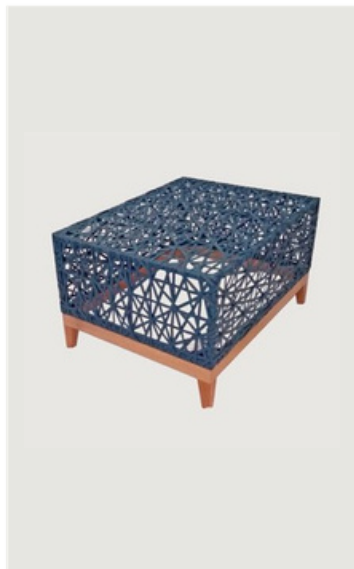
MESA DE CENTRO EM CORDA NÁUTICA BASE EM MADEIRA