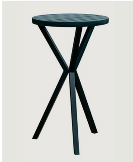
MESA BISTRÔ TAMPO RIPADO EM ALUMÍNIO