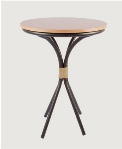
MESA BISTRÔ TAMPO EM MADEIRA

Mesa Bistrô, ideais pra fazer refeições, petiscar, tomar café ou mesmo aproveitar o happy hour. Podem ser usadas em áreas externas e internas.