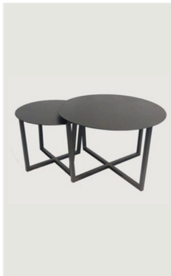
MESA DE CENTRO EM CHAPADO DE ALUMÍNIO