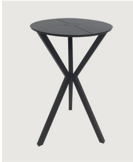
MESA BISTRÔ TAMPO EM CHAPADO DE ALUMÍNIO