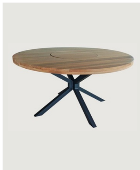
MESA REDONDA COM GIRO TAMPO EM MADEIRA CENTRO EM MADEIRA