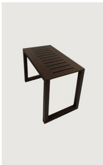
MESA DE CENTRO EM ALUMÍNIO RIPADO

Mesas de Centro para áreas externas e internas em alumínio, com acabamento em fibra sintética, corda náutica ou madeira. Garantem sofisticação e requinte.