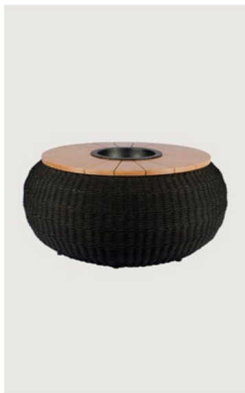
MESA DE CENTRO CHAMPANHEIRA SEM TAMPA EM CORDA NÁUTICA TAMPO EM MADEIRA