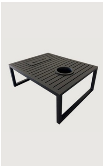
MESA DE CENTRO CHAMPANHEIRA COM FOGAREIRO EM ALUMÍNIO RIPADO