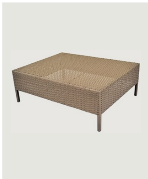
MESA DE CENTRO EM FIBRA SINTÉTICA