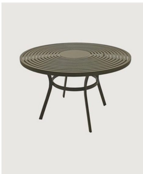
MESA RETANGULAR TAMPO EM MADEIRA SEM GIRO

A: 73 cm A: 73 cm A: 73 cm D: 100 cm D: 110 cm D: 120 cm