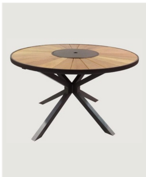
MESA REDONDA COM GIRO TAMPO EM MADEIRA CENTRO EM ALUMÍNIO

Mesas área externa ou interna de vários tamanhos, estrutura em alumínio, pintura eletrostática, tampo demadeira, ripado de alumínio, base para vidro ou pedra.