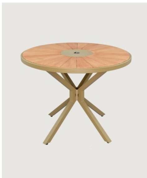
MESA REDONDA SEM GIRO TAMPO EM MADEIRA CENTRO EM ALUMÍNIO