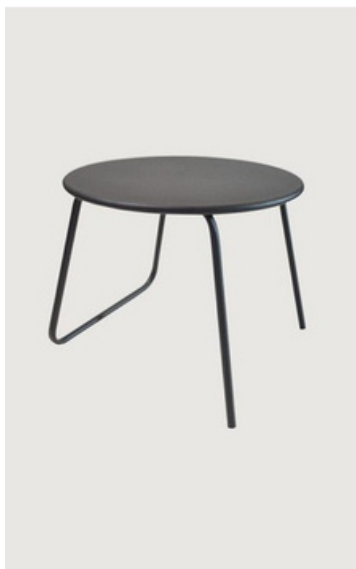
MESA DE CENTRO EM CHAPADO DE ALUMÍNIO