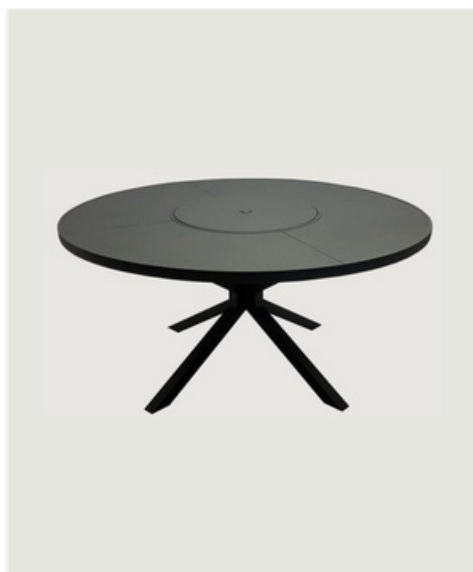
MESA REDONDA 4 PARTES COM GIRO TAMPO CHAPA ALUMÍNIO CENTRO EM ALUMÍNIO

Mesas áreaexterna ou interna de vários tamanhos, estrutura em alumínio, pintura eletrostática, tampo demadeira, ripado de alumínio, base para vidro ou pedra.