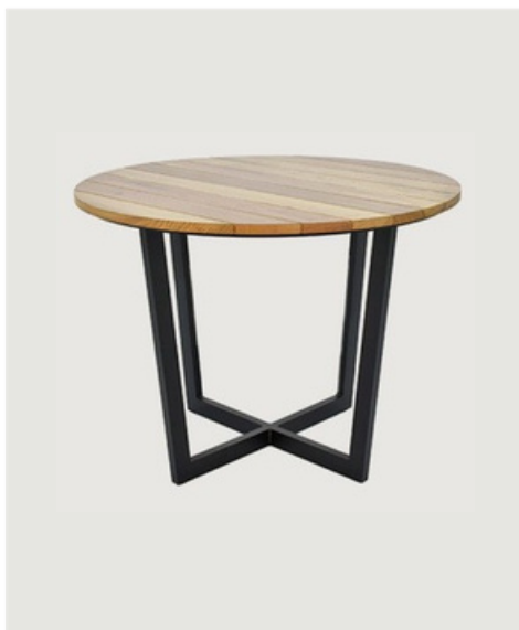
MESA REDONDA TAMPO EM MADEIRA