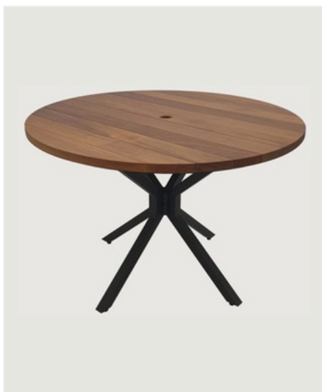
MESA REDONDA SEM GIRO TAMPO EM MADEIRA