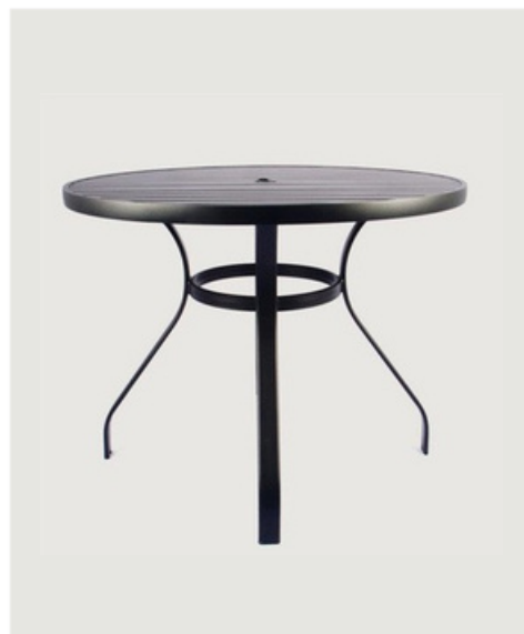
MESA REDONDA SEM GIRO TAMPO RIPADO EM ALUMÍNIO