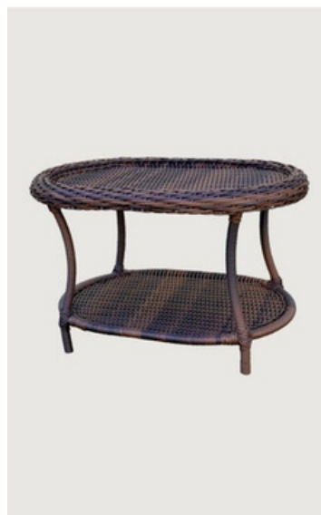
MESA DE CENTRO QUADRADA EM ALUMÍNIO RIPADO