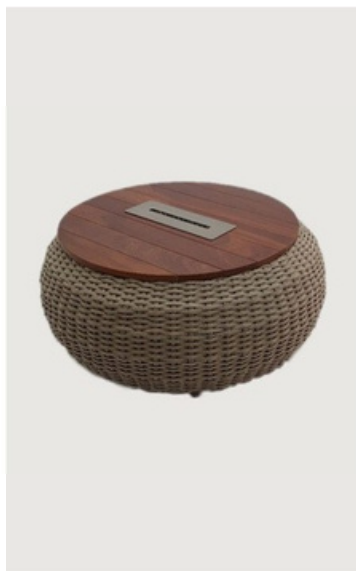
MESA DE CENTRO EM CORDA NÁUTICA COM LAREIRA E TAMPO EM MADEIRA