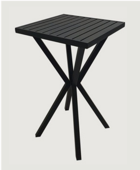
MESA BISTRÔ TAMPO RIPADO EM ALUMÍNIO