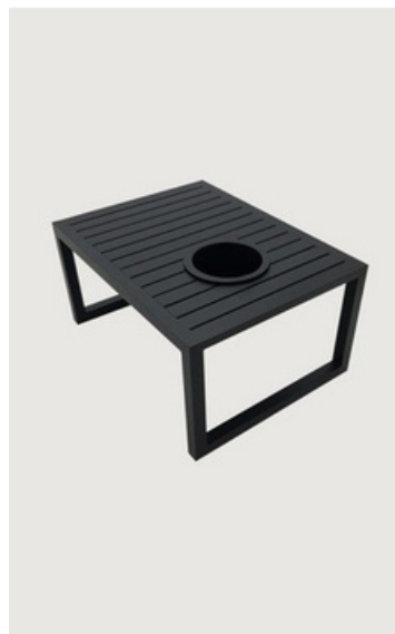
MESA DE CENTRO CHAMPANHEIRA EM ALUMÍNIO RIPADO