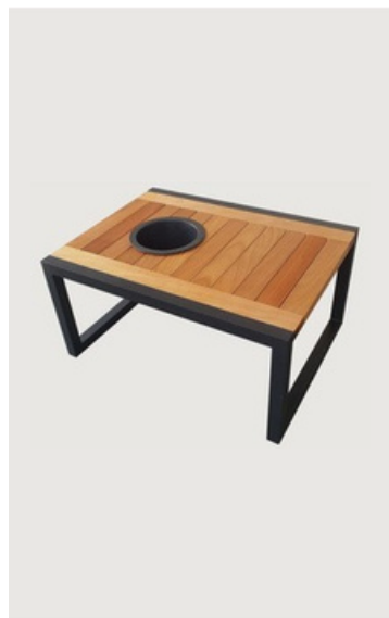
MESA DE CENTRO CHAMPANHEIRA EM MADEIRA RIPADA