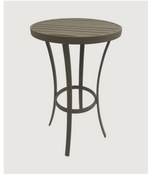
MESA BISTRÔ TAMPO RIPADO EM ALUMÍNIO