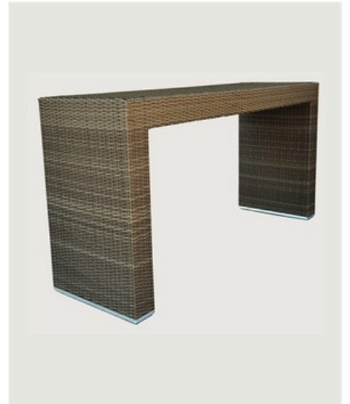
MESA BISTRÔ EM FIBRA SINTÉTICA