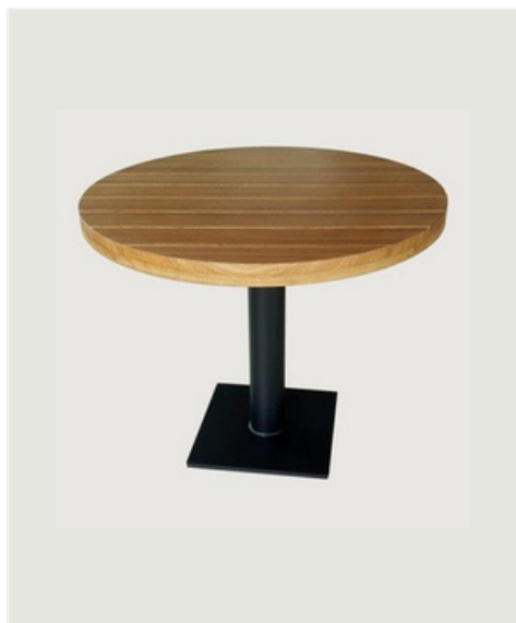
MESA REDONDA TAMPO EM MADEIRA