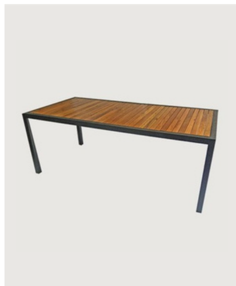
MESA RETANGULAR TAMPO EM MADEIRA