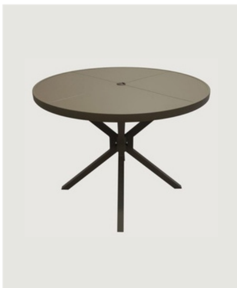
MESA REDONDA SEM GIRO TAMPO CHAPA ALUMÍNIO 4 PARTES