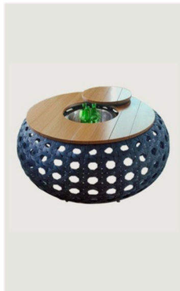
MESA DE CENTRO FIBRA SINTÉTICA