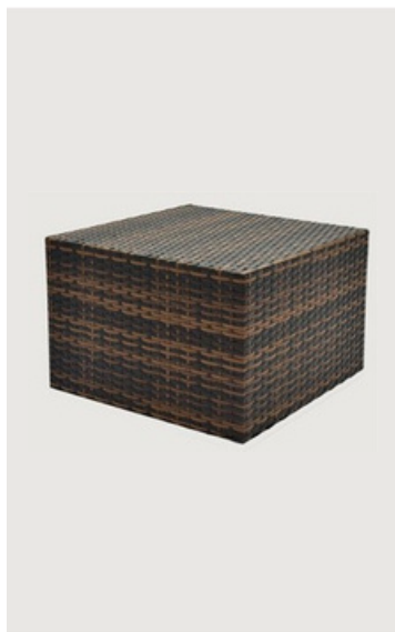
MESA DE CENTRO EM FIBRA SINTÉTICA