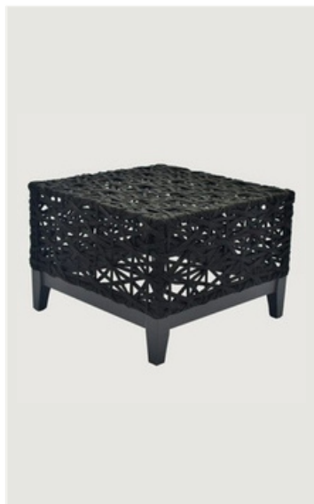
MESA DE CENTRO EM CORDA NÁUTICA BASE EM ALUMÍNIO