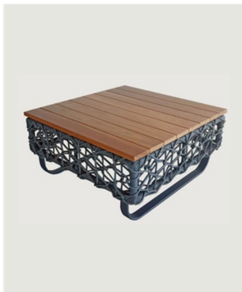
MESA DE CENTRO EM CORDA NÁUTICA TAMPO EM MADEIRA