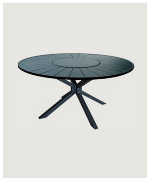
MESA REDONDA COM GIRO TAMPO EM ALUMÍNIO CENTRO EM ALUMÍNIO