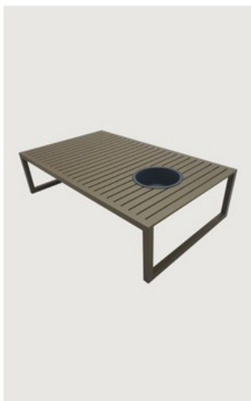
MESA DE CENTRO CHAMPANHEIRA EM ALUMÍNIO RIPADO