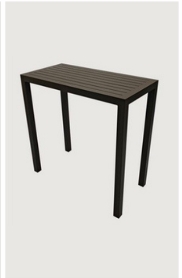
APARADOR TAMPO RIPADO ALUMÍNIO