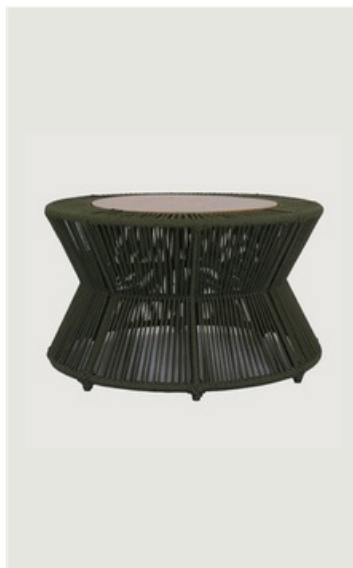
MESA DE CENTRO EM CORDA NÁUTICA TAMPO EM MADEIRA