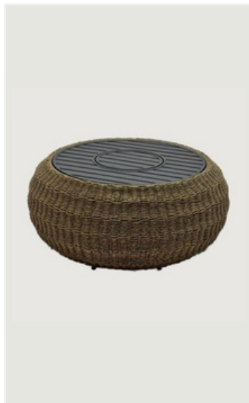
MESA DE CENTRO EM CORDA NÁUTICA COM TAMPO RIPADO ALUMÍNIO