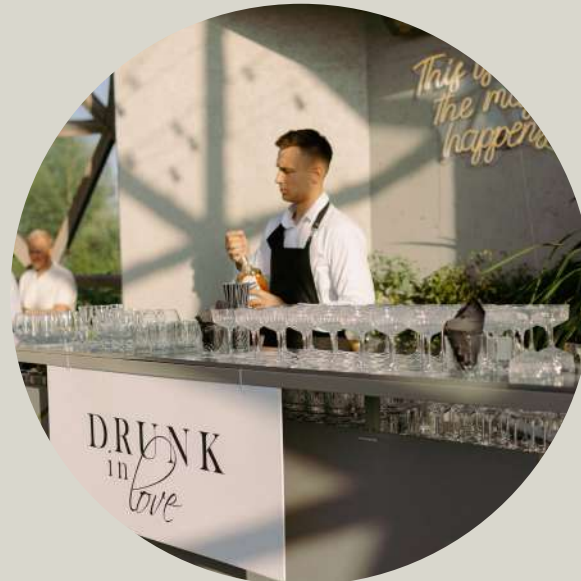
Mobilus kokteilių baras