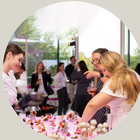
Interaktyvus užkandžių baras