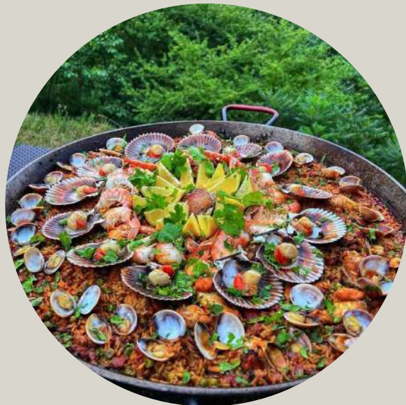
Open Air maisto pateikimas