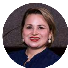
Dra. Ludivina Leija Presidenta del Instituto Mexicano de Contadores Públicos