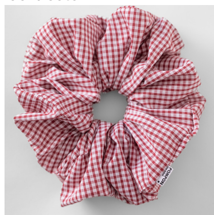
bordeaux MAXI 39e BABY 35e