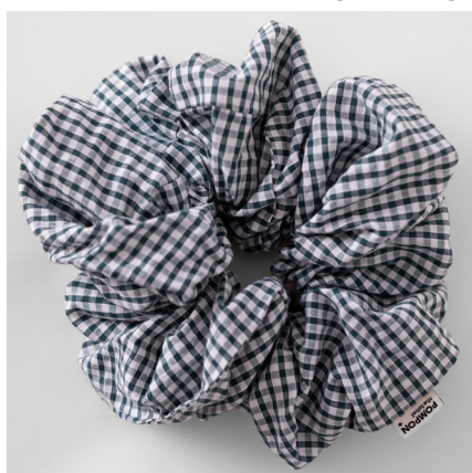
vert foncé MAXI 39e BABY 35e