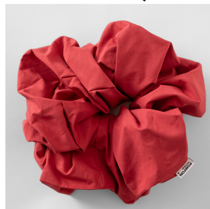
Brique MAXI 39e