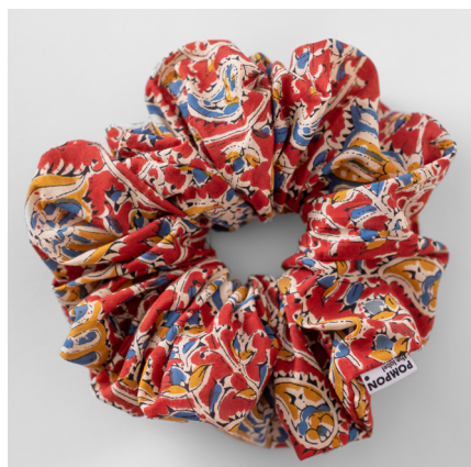
Ladoo MAXI 39e BABY 35e