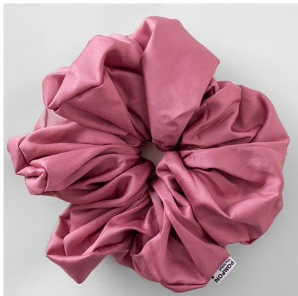
vieux rose MAXI 39e BABY 35e