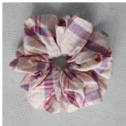
Quatre heure MAXI 39e