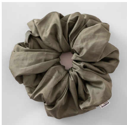
kaki MAXI 39e