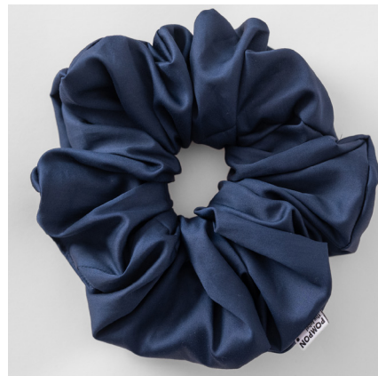
marine MAXI 39e BABY 35e